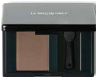
Magic Shadow 47 Smooth Cappuccino

MEERESBLICK Mystisch schimmerndes Blaugrün umrandet den Blick, in den man wieder und wieder eintauchen möchte. Einen faszinierenden Kontrast schafft seidig glänzendes Rosé auf Lidern und Nägeln. Die hellen Nuancen des Highlighter-Trios lassen den Teint erstrahlen. Der Mund verführt in seidig-matter Farbe, die lässtig mit den Fingern aufgetupft und zart umrandet wird.