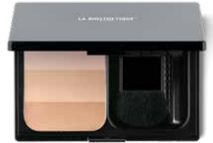
Highlighter-Trio Rose oder Gold