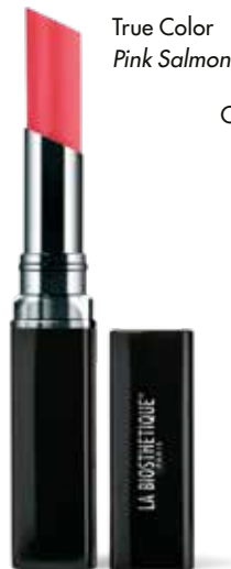
True Color Pink Salmon

Steffen Zoll, Make-up Artist für La Biosthétique